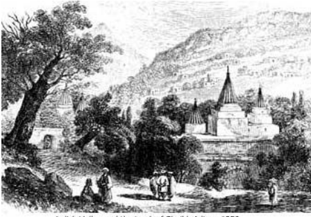
Lalish Valley and the tomb of Sheikh Adi ca. 1850

Nimûneyek ji wan ciyên sediqandina Êzdiyan jê LALIŞA NÛRANÎ ye.